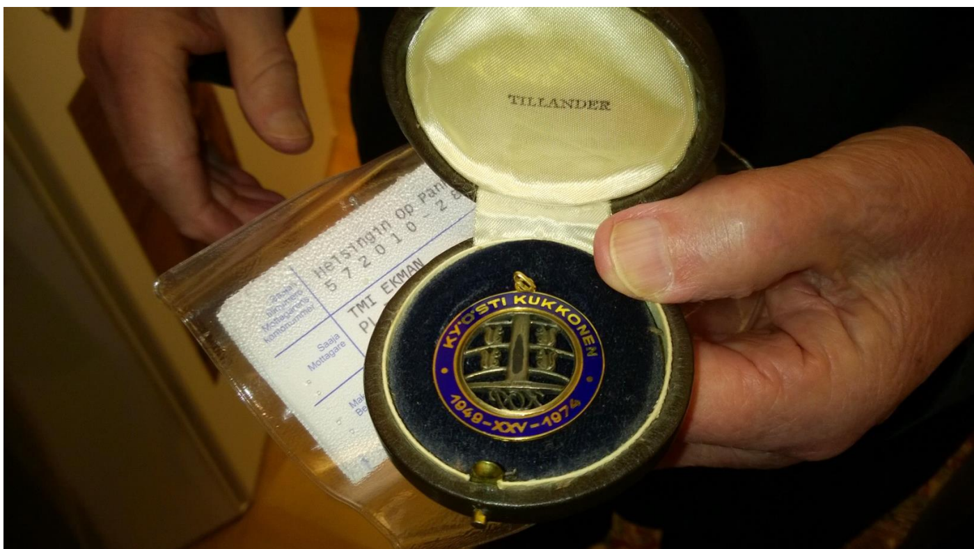
Lahjoitettu jetoni.